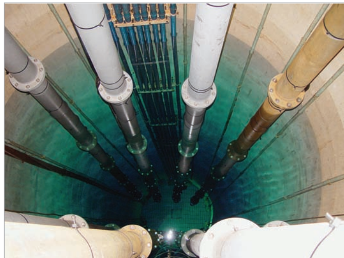
Brunnen des WLVB Nördliches Burgenland (li.): Die Versorgung der Bevölkerung im Burgenland mit sauberem Trinkwasser ist dem GVV ein ganz besonderes Anliegen.