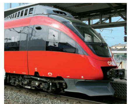
Bitte umsteigen! ... in Wiesen/Sigleß

Die neue Anlage wird die Attraktivität des öffentlichen Verkehrs weiter steigern und eine wesentliche Verbesserung für die Pendler aus der Region bringen. In den letzten Jahren haben Land, Gemeinden und die ÖBB gemeinsam Park & Ride-Anlagen u.a. in Mattersburg und Deutschkreutz errichtet.