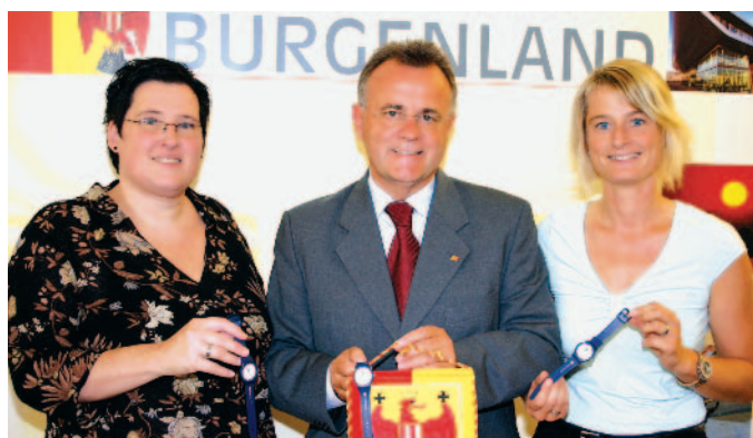
VereinsfunktionärInnen erhielten als Dankeschön eine Uhr.

Das Burgenland verzeichnet mit seinen rund 4.000 Vereinen und mehr als 100.000 ehrenamtlich Aktiven die zweithöchste Vereinsdichte aller Bundesländer auf. Damit wird deutlich, dass Ehrenamtlichkeit im Burgenland einen besonderen Stellenwert hat. Um dieses unentgeltliche Engagement zu würdigen, hat sich die Burgenländische Landesregierung dazu entschlossen, einen „Tag der Vereine“ ins Leben zu rufen. Mit