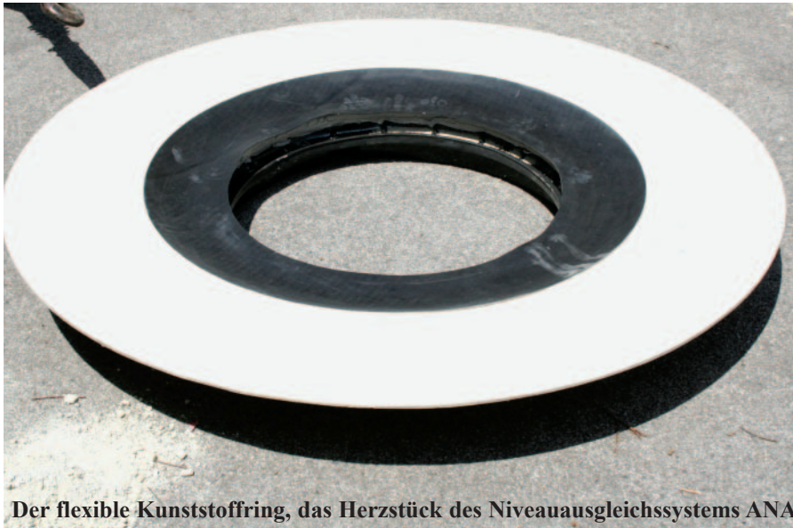
Der flexible Kunststoffring, das Herzstück des Niveausgleichssystems ANA