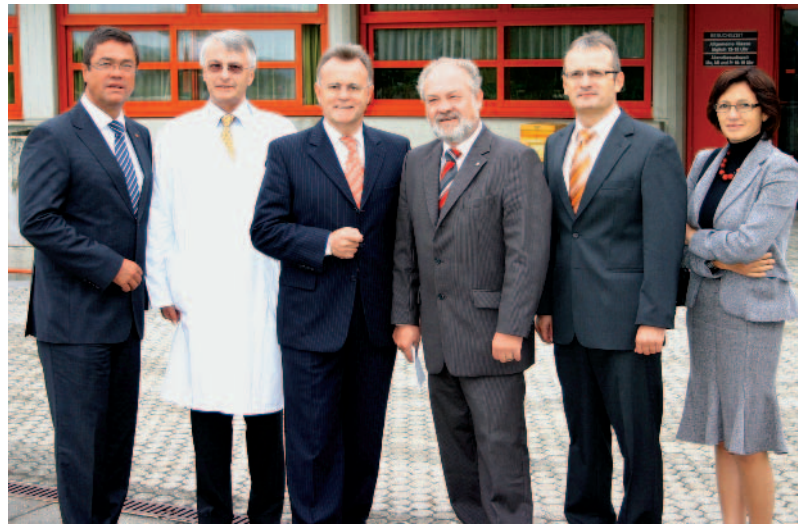
In Oberwart kann man erleichtert in die Zukunft blicken. Das Krankenhaus wird modernisiert und mit zeitgemäßen Strukturen ausgestattet.